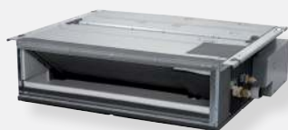
FDXM-F inbyggd undertaksmodell